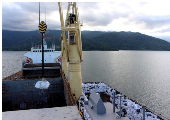
Pemuatan FeNi ke dalam mother vessel