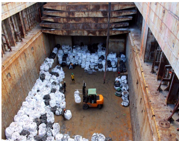
Pemuatan FeNi ke dalam mother vessel